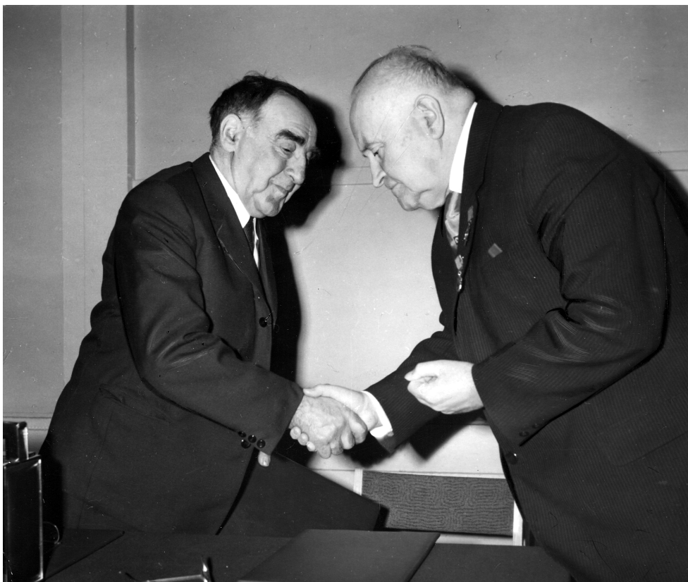
И. С. Брук и академик А. Л. Минц, начало 1970-х годов

сказал: «В настоящее время всем известна универсальная электронная вычислительная машина БЭСМ Академии наук СССР, разработанная и построенная в 1952 году под руководством академика Лебедева. Эта машина по своим данным превосходит все европейские и большинство американских машин.