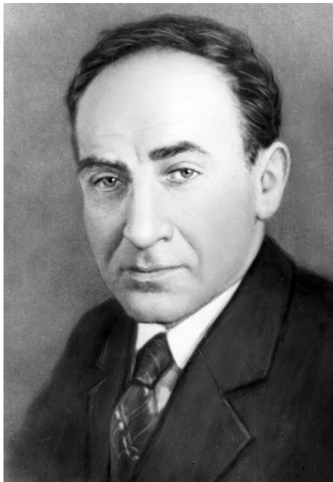
Исаак Семенович Брук, 1950-е годы

К именам обоих приложимо определение «первые».