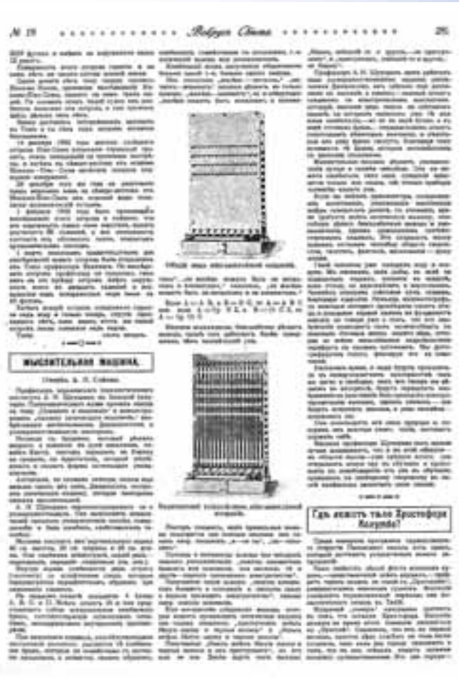
Рис. 6. Статья А. Н. Сокова («Вокруг света», 1914 г.)

В приведенном отрывке обнаруживается весь спектр негодных полемических приемов. Прежде всего, Щукарёв ни единого слова не говорит о «рационализации умственного труда» и тем более не предлагает для ее осуществления «поручить мыслительную функцию машине». Он нигде не утверждает, будто машина «будет мыслить за человека». Утверждение же